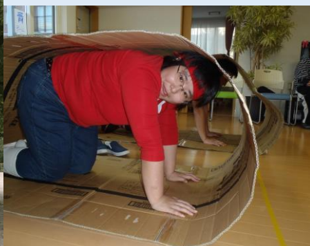
運動会 キャタピラレース その他いろんな競技があります!!