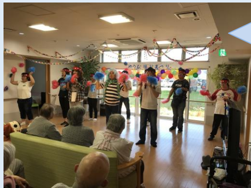
ゆうび祭りの様子