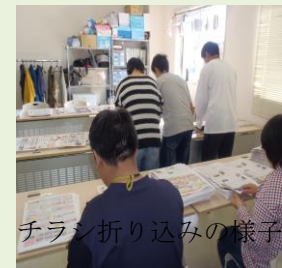
チラシ折り込みの様子

情報誌の「道新デリバリー」「ちゃんと」を毎週配布しています。初めはスタッフ同行で一緒に行ないますが慣れると1人で行きます。配布した分の工賃が貰えます。その他メール便の配達も行っています。